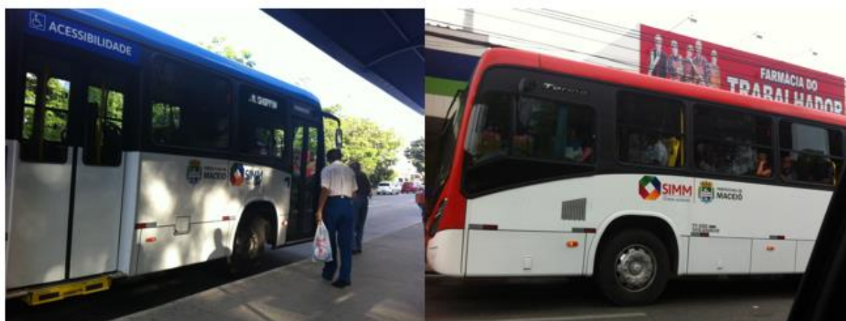
Fig. 2 Mudança do Layout dos ônibus e renovação da frota