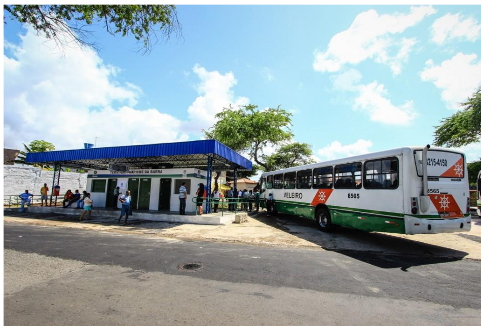
Fig. 4 Terminal do Trapiche da Barra: o 18º terminal reformado.

O projeto de melhoria da integração do transporte público em Maceió também contou com a reforma dos terminais de integração física, como pode ser visto na Figura 4.